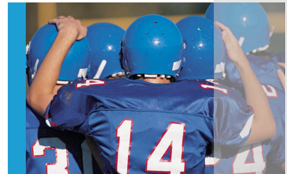
TIMOTHEUS Der einflussreiche Leiter